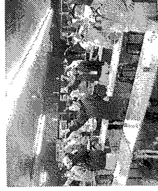
林ベニヤ支部2024春闘団交報告集会 (七尾工場食堂)

※連合石川スタッフユニオンは別途要求。 ※正)正社員、再)再雇用者、嘱)嘱託、パ)パート、●企業内最低賃金要求