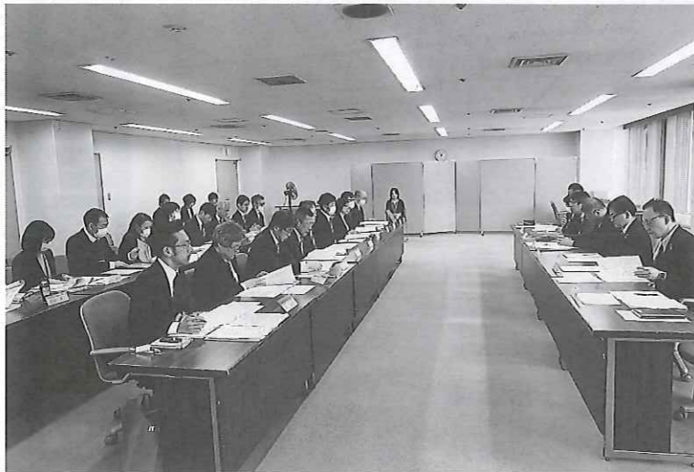
▲活発な意見交換が行われた会議の様子

発行所 一般社団法人・ 大阪労働者福祉協議会 〒540-0031 中央区北浜東3番14号 電話06(6943)6025 毎月1日発行 1部20円 発行人 黒田悦治 編集協力・機関紙広報研究センター