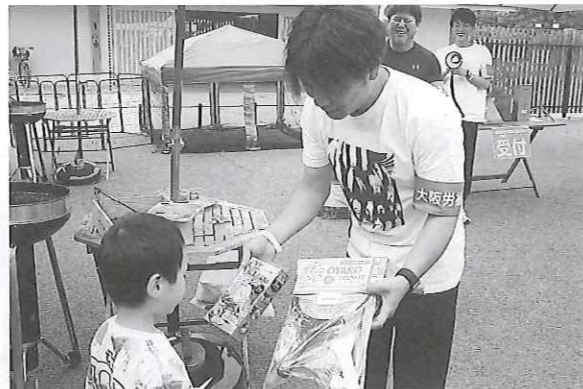
▲仁徳天皇陵を半周したあと、大仙公園内の「ICOROBA Cafe Terrace」でBBQで盛り上がった