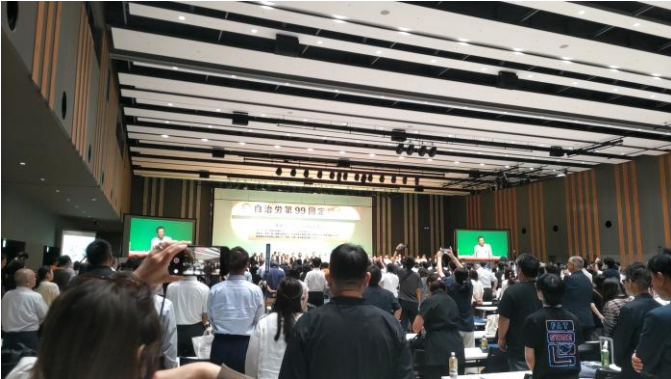
第99回自治労定期大会の様子

3日間渡って、開催された第99回自治労定期大会はこれで終了した。次回は第100回であって、第7号議案で提案された、埼玉県大宮市での開催ということで可決された。