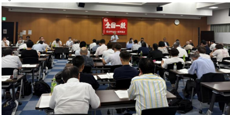
全国一般評議会第21回定期大会の様子

組合員一人ひとりが日常活動の担い手となって自覚を持って活動するものであり、そのため組合員一人ひとりがアンテナを高くし、身近にいる未組織労働者の組織化に取り組み、活動をサポートする役員は職場組合員に寄り添い悩みや要求を汲みあげ、課題解決と要求実現にむけて最大限の努力をはかっていく。などが提案され、可決した。